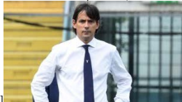
Simone Inzaghi[ caption ]

adesso, non siamo piu' una sorpresa ma abbiamo l'obbligo di provarci fino alla fine, sappiamo che e' difficile ma abbiamo dimostrato di poterci stare e vogliamo rimanere li' in alto. L'obiettivo e' cercare di fare sempre bene, 40 punti in 20 partite sono tanti, va fatto un plauso a questi ragazzi: a inizio luglio nessuno pensava che la Lazio facesse cosi' tanti punti e ce ne manca anche qualcuno", dichiara il tecnico biancoceleste Simone Inzaghi. Un grande applauso ad Inzaghi e ai suoi