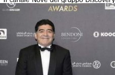
Diego Armando Maradona/[caption]

id="attachment_35759" align="alignnone" width="300"]