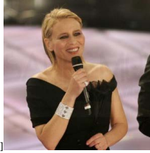
Maria De Filippi[/caption]

Pier Silvio Berlusconi, editore della De Filippi, ha dato il via libera a formare la coppia più esplosiva degli ultimi vent'anni. Anche il marito Maurizio Costanzo, il suo più fidato consigliere, l'ha supportata dicendola: "Vai, buttati, e che sarà mai". Carlo Conti e Maria De Filippi si troveranno a Sanremo una settimana prima che inizi il Festival per decidere quello che succederà sul palco. A Conti spetterà la parte "classica" di annunci delle canzoni, la