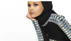
[caption id="attachment_41882" align="alignleft" width="302"] Halima Aden[/caption]

Ma soprattutto far capire che la diversità non deve essere in nessun modo un ostacolo all'integrazione.